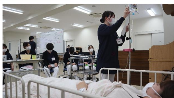
ベッドサイドを再現したシミュレーション