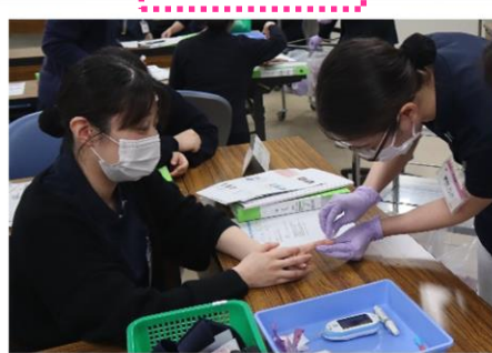
初めての針の穿刺に緊張...