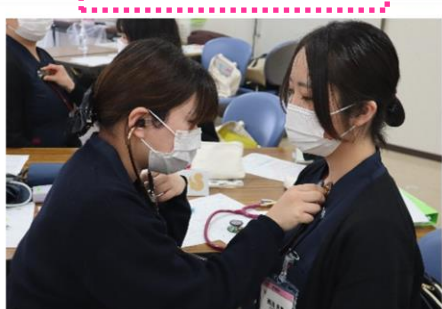
フィジカルアセスメント