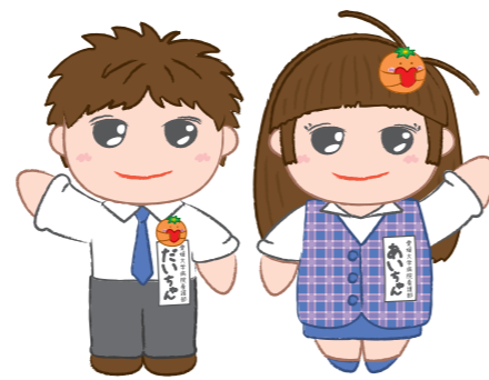
病院マスコット あいちゃん・だいちゃん

総合受付⑤(入院受付)にお越しください。 混雑時は番号順に手続きをいたします。 受付時間は、月~金(祝日を除く)8:30~です。