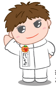
病院マスコット だいちちゃん