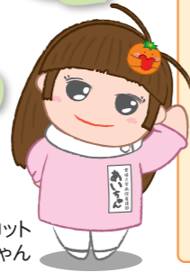
病院マスコット あいちゃん